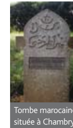
Tombe marocaine située à Chambry

indigènes put se faire notamment par l'appui et le sacrifice de la 19 ème Compagnie du 276 ème Régiment d'Infanterie du Lieutenant Charles Péguy lui-même enterré dans la Grand Tombe sur la route de Chauconin-Neufmontiers à Villeroy.