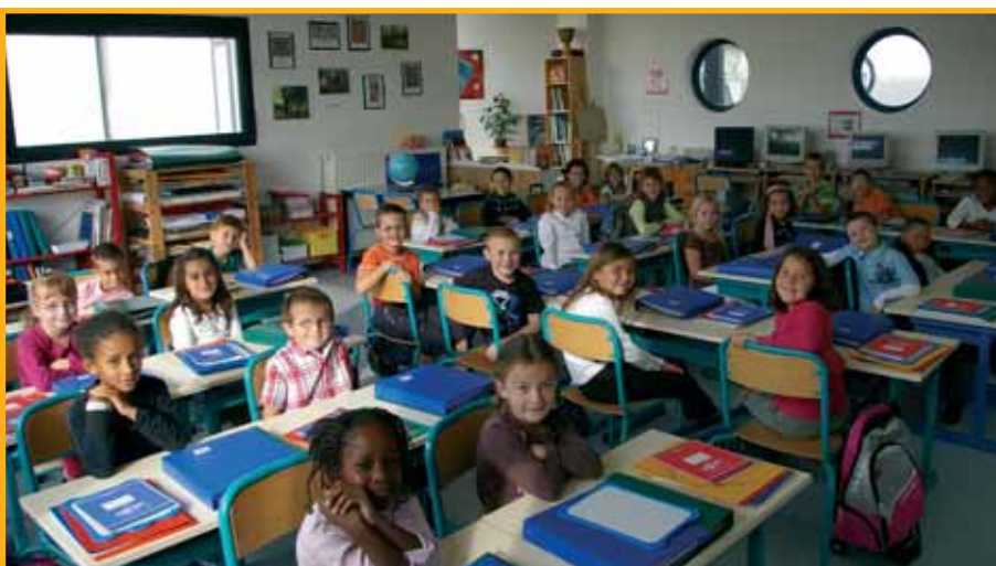
▶ La rentrée en sourire.