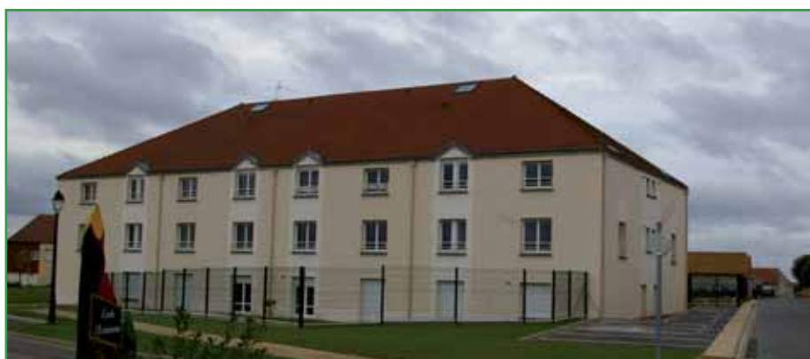
► 63 rue Charles Péguy : l'action de la commune a contribué à l'achèvement du bâtiment

Ainsi, une fois ces deux lotissements réalisés, la commune aura quasiment atteint l'objectif de croissance démographique imposé par le SCOT.