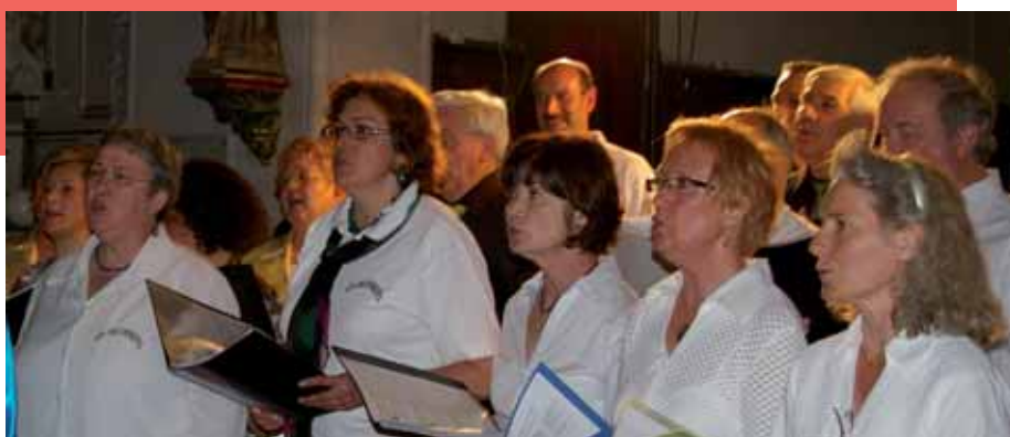
► La chorale pendant la fête des associations