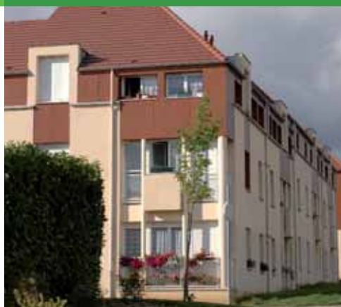
► Des logements locatifs agréables