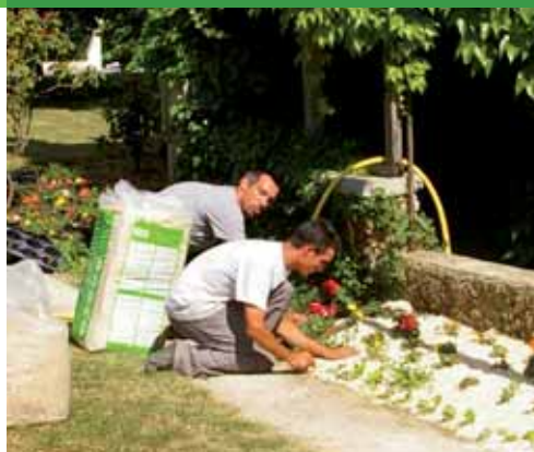
► Fleurissement du village