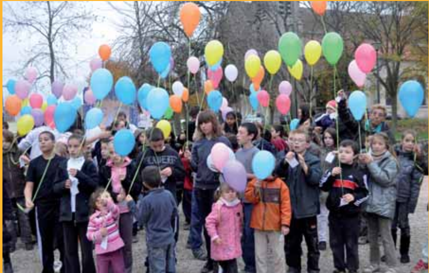
► Clôture de la journée autour des 20 ans de la convention des droits de l'enfant