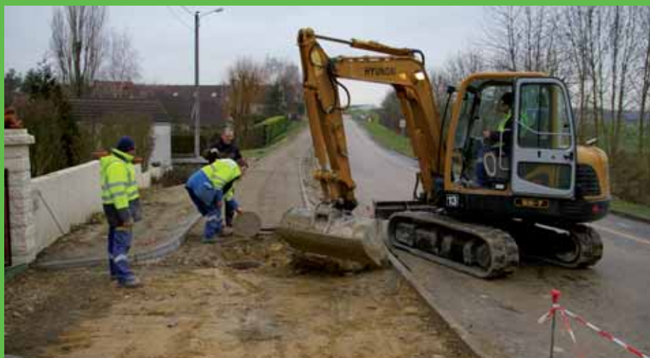
► Rue Charles Péguy : offrir aux piétons un espace de circulation sécurisé et agréable