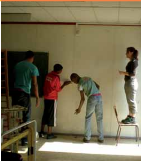
► Les jeunes redécorent leur espace