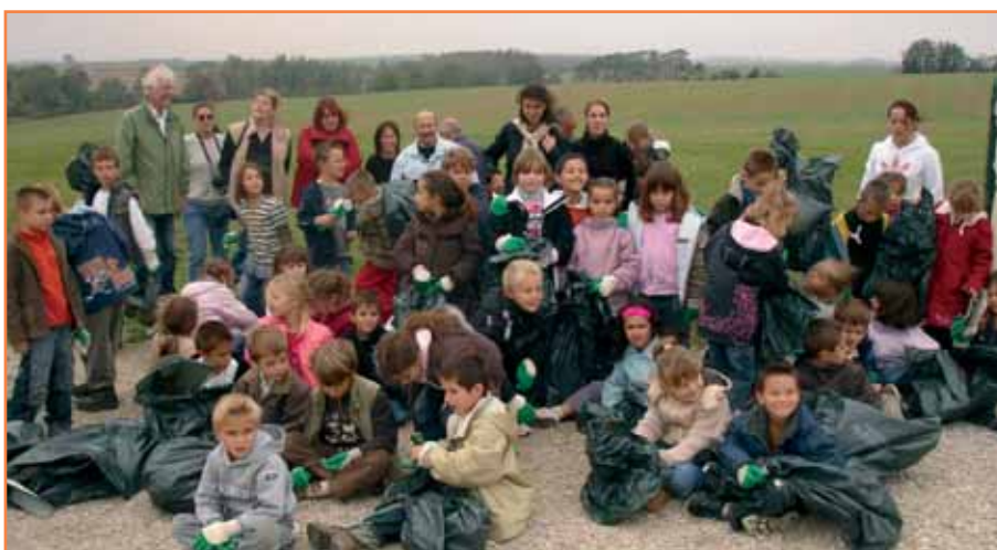
▶ Les écoliers sont régulièrement sensibilisés au respect de la nature.

Des actions envers la petite enfance existent sur la commune : la municipalité met à disposition de l'association Familles Rurales la salle Colucci, plus accessible que le précédent local, lui permettant d'accueillir les enfants de 0 à 3 ans dans le cadre de la Récré ; l'Association Sports Loisirs et Culture initie les plus petits aux arts plastiques.