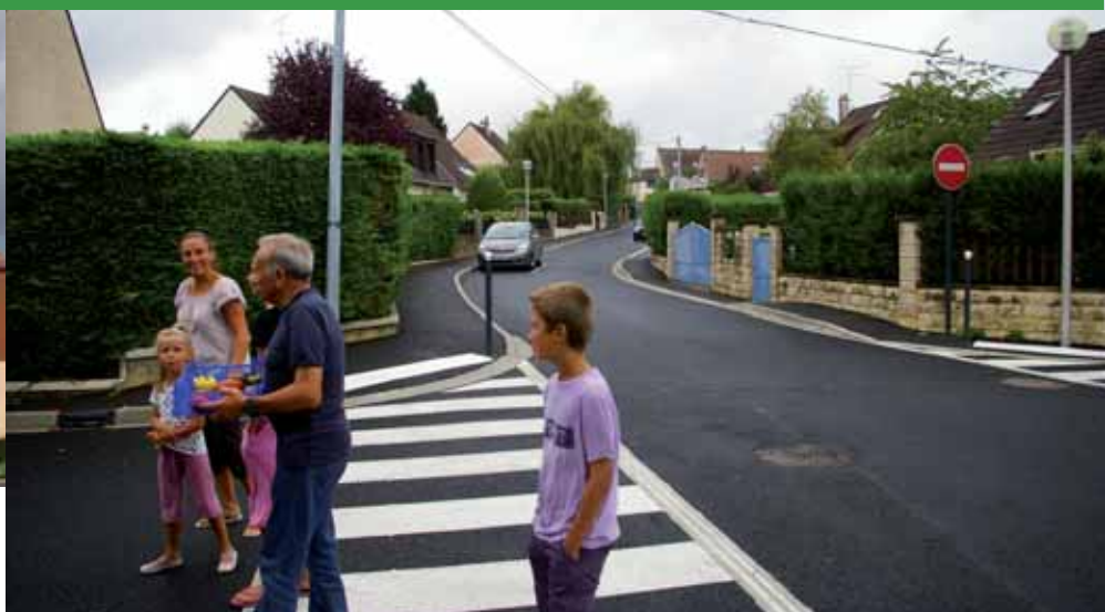
► La rue de la Chantonne a pris un coup de jeune