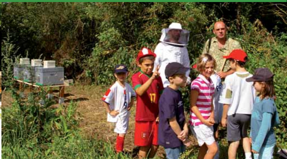
► Découverte des ruches par les enfants du village