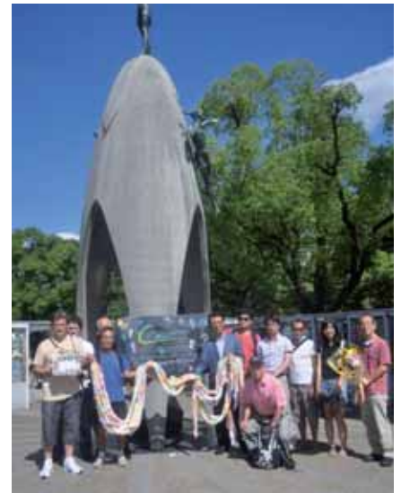
► Remise de 1000 grues au Japon

Bourdeau. Nous veillerons à ce que ces espaces répondent également aux besoins des plus jeunes de nos habitants (0-3 ans). La commission « nouveaux équipements » sera également appelée à réfléchir sur le devenir de l'actuel terrain d'évolution (proche du cimetière) et fera des propositions pour que nos jeunes puissent également trouver leur place.