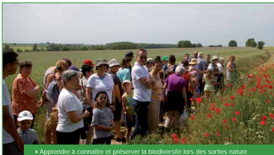
► Apprendre à connaître et préserver la biodiversité lors des sorties nature régulièrement organisées avec la Maison de l'Environnement.

L'ouverture au public des 6,6 hectares du Bois du Télégraphe s'est achevée en 2009. Sous l'impulsion de la commune, le CG77 a acquis 7,6 hectares supplémentaires en 2011. Dorénavant, sur les 46 hectares que compte l'ENS