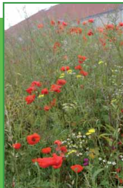
► La fauche tardive préserve la biodiversité

Toutes les informations utiles sur le recyclage des déchets ménagers ont été diffusées lors de la réunion