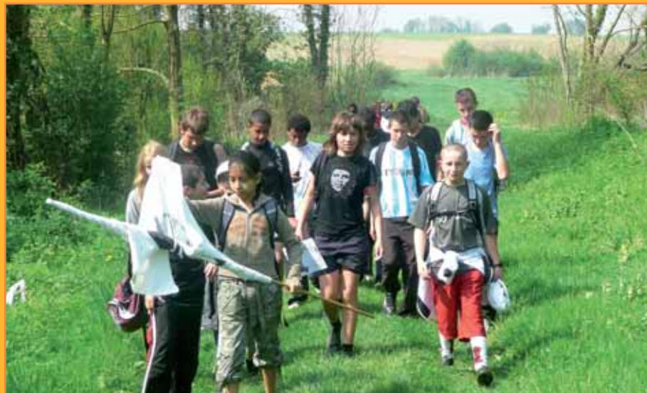
► Chasse au trésor à Chauconin-Neufmontiers