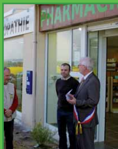
► La bataille aura été longue pour accueillir une pharmacie au cœur du village