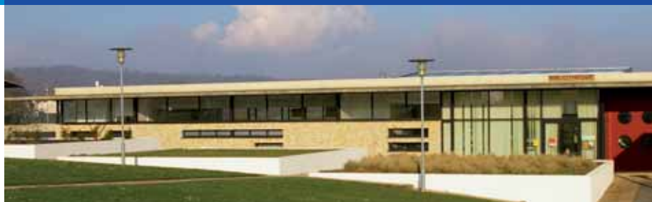
► L'école, un investissement important pour la commune