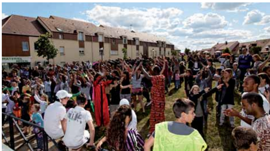
► De l'ambiance au Festi'jeunes

Des actions de communication auprès des jeunes et des parents sont régulièrement entreprises pour faire connaître la structure. Ainsi les animateurs interviennent une fois par semaine au collège. Une passerelle entre les CM2 de l'espace Jules Verne et l'Espace Jeunesse a été mise en place le mercredi matin et des opérations