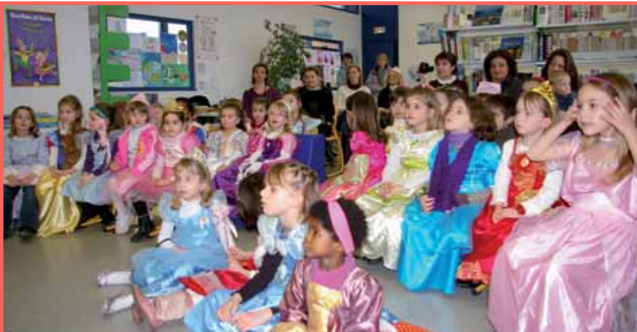
► Conte de princesses à la bibliothèque