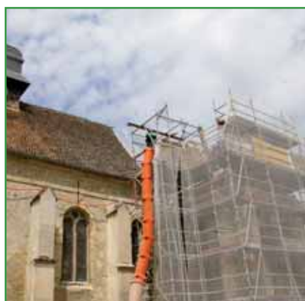
► Restauration de l'Eglise St Saturnin : un chantier au long cours