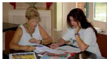
► Préparation de la première célébration de la journée des droits des femmes